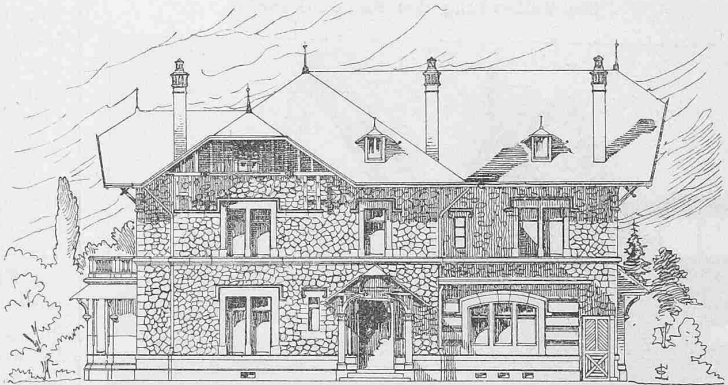
Fig. 50. Villa Chantre à Champel. — 1 : 250. — Arch.: MM. K. & Fr. Fulpius