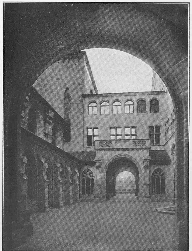
Abb. 25. Blick in den Hof II aus der westlichen Halle.

Längs der kanalisierten Strecke der kleinen Schlieren sind nur einige Schädigungen an der Steinböschung vorhanden. Die hölzerne Brücke für die Ueberführung der Landstrasse von Alpnachstad nach Alpnach ist vollständig unversehrt geblieben, obwohl der Wasserspiegel bis etwa 0,70 m an die Bretterverkleidung hinauf gereicht hat. Der eiserne Steg dagegen, der 250 m weiter oben, am obern Ende der kanalisierten Strecke des Wildbaches, zur Ueberführung eines Weges über denselben diente, wurde fortgerissen und blieb am Fusse des Schuttkegels im Kiesfang mit Geschieben überdeckt liegen. Während vom Kiesfang bis zum Steg beinahe keine Geschiebe im Bachbett zurück blieben, ist dasselbe hier auf einmal mit allen Arten