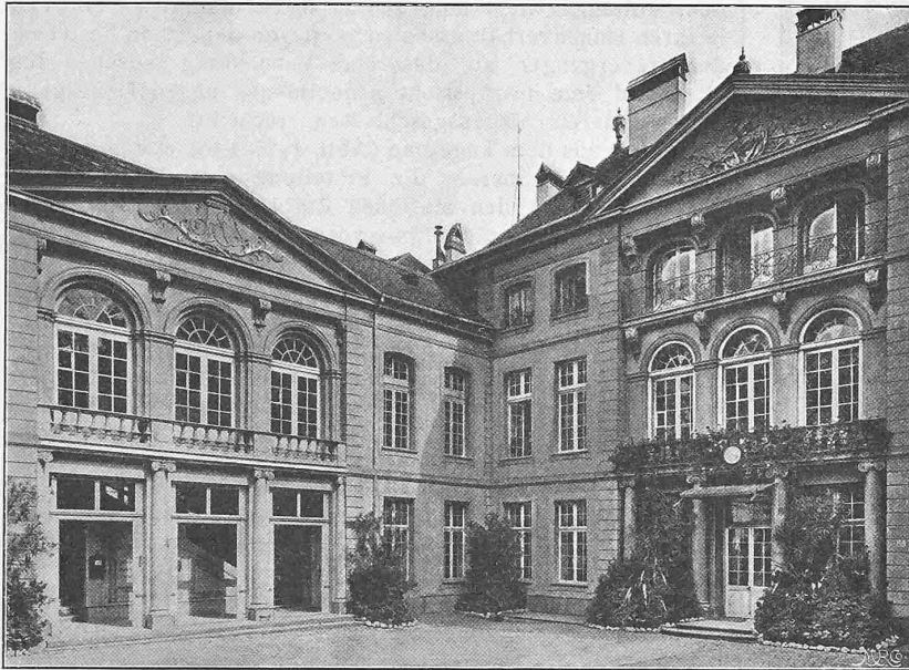
Abb. 3. Der Erlacher Hof in Bern, erbaut 1752.

Die Darstellung der hervorragenderen Gebäude einer Stadt kann in zweierlei Art geschehen. Entweder in rein historischem und künstlerischem Sinn, wobei einem wissenschaftlich beschreibenden Text malerische Darstellungen der betreffenden Objekte zur Seite gestellt werden oder aber in historisch und technischer Hinsicht, wenn neben der geschichtlichen Beschreibung auf den praktischen, technischen