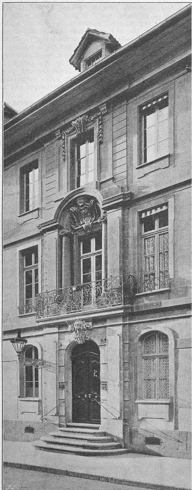
Abb. 2. Haus Marquard in der Amtshausgasse in Bern.

Für die Linie über Voltaggio stehen hiefür zur Verfügung 19 Stunden = 1140 Min. Hievon gehen ab für die Beförderung von 6 Eilzügen zu 18 Min. = 108 Min. „ 5 Lokalzügen zu 25 „ = 125 „ 233 Min. Bleiben für die Beförderung der Lastzüge 907 Min. welche Zeit genügt für 907 : 54 = 26 Züge zu 49 Wagen = 1274 Wagen.