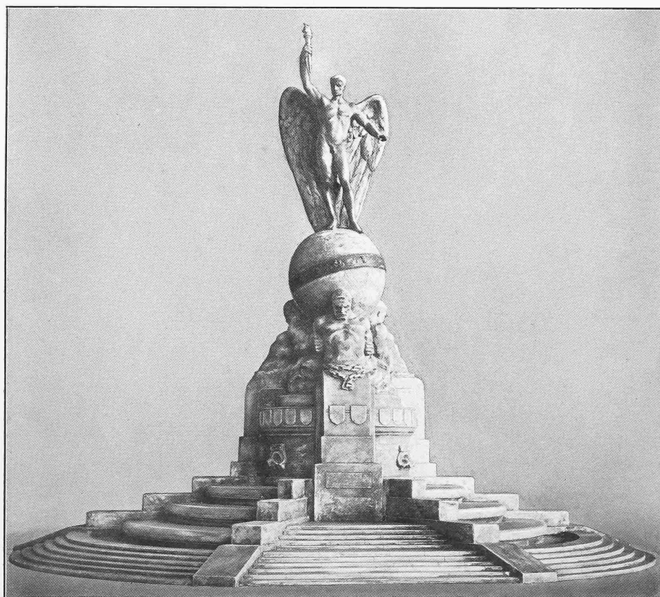
I. Preis «ex aequo». Verfasser: Georges Morin in Berlin.