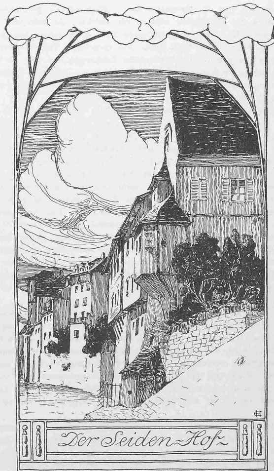
Abb. 2. Aus «Altes und Neues aus Basel».

Die romanische und gotische Baukunst. Der Kirchenbau. Zweites Heft. Von Max Hasak , Regierungs- und Baurat in Grunewald b. Berlin. Zweiter Teil, IV. Band, Heft 4 des «Handbuchs der Architektur». Mit 511 Abbildungen im Text und 12 Tafeln. 1903. Arnold Bergsträsser, Verlagsbuchhandlung, A. Kröner in Stuttgart. Preis geb. 18 M., geb. 21 M.