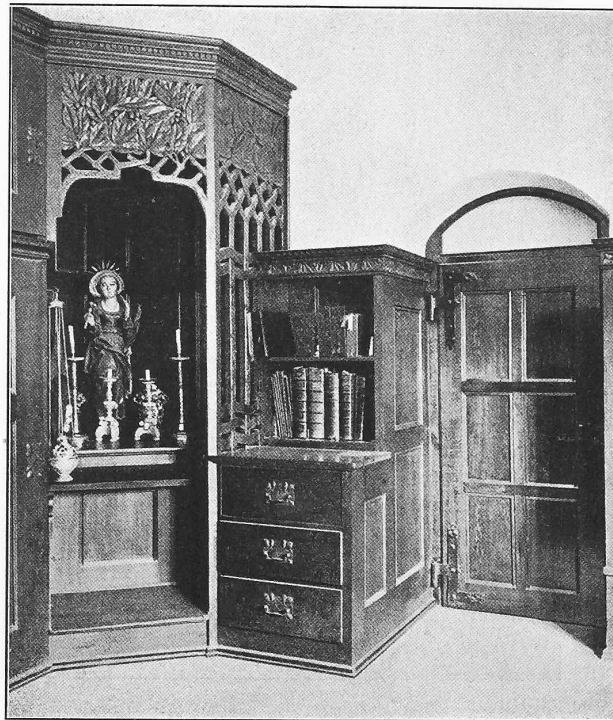
Abb. 18. Aus der Sakristei.

Von Karl Moser, Architekt in Firma Curjel & Moser in Karlsruhe.