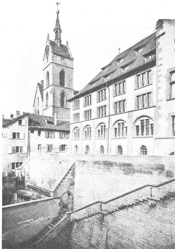
Abb. 19. Blick aus dem Grossratssaal auf das Archivegebäude und den Martinskirchturm.

Von den Architekten E. Vischer und E. Fueter († 1901) in Basel.