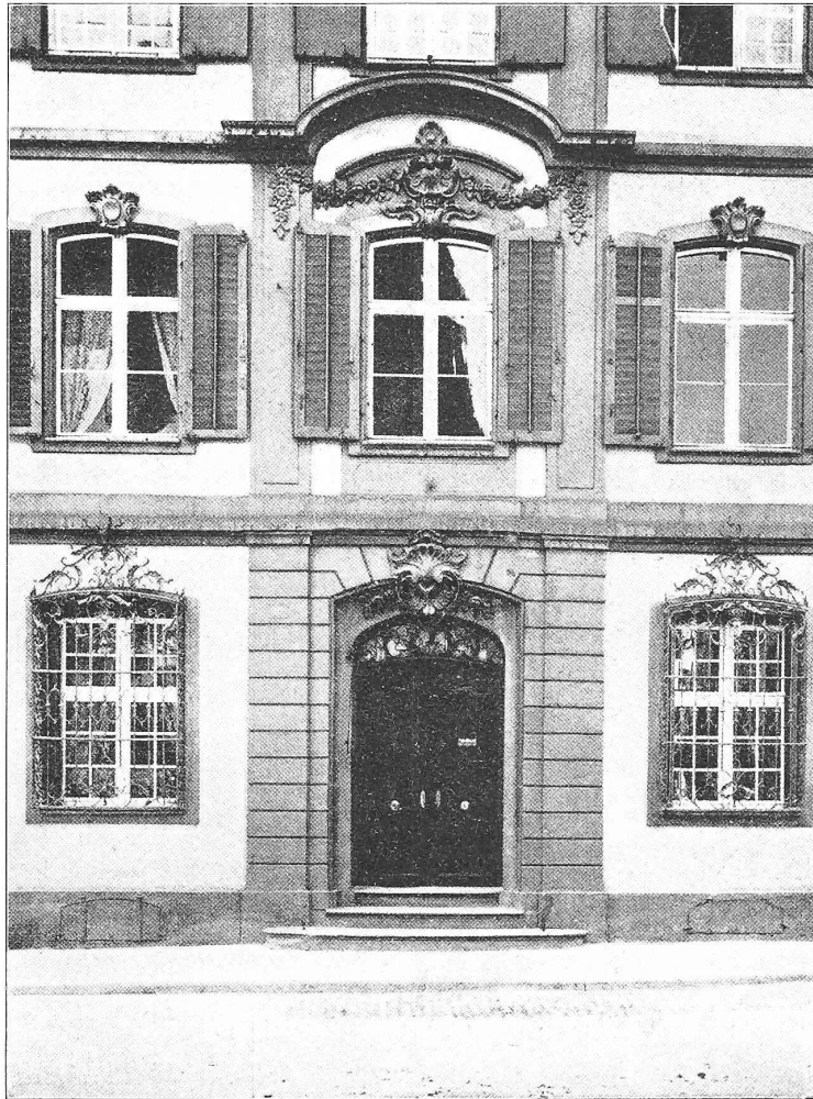
Abb. 1. Mittelpartie des Hauses «Zum Delphin» .