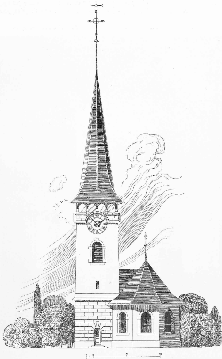
Abb. 3. Ansicht der Chorseite. — Masstab 1 : 300.

Von Architekt Karl InderMühle, Münsterbaumeister in Bern.