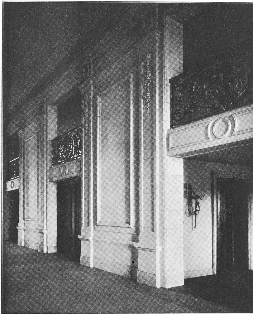
Abb. 16. Blick in den Vorsaal vor dem Foyer des I. Ranges.

(Der Inhalt dieser Petition setzt sich im wesentlichen aus folgendem zusammen: