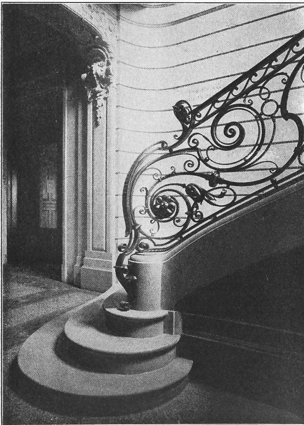
Abb. 18. Detail vom Geländer der Treppe zum I. Rang.