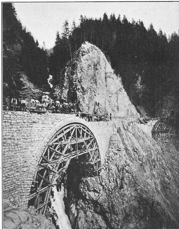
Abb. 21. Die Stulsertobel-Brücken im Bau.

ausarbeiten und vorlegen. Diese Kostenvoranschläge gelten für die Firmen als verbindliche Uebernahmsofferten, während der Staat und die Stadt sich selbstverständlich für den Fall der Beteiligung am Bau des Werkes das Recht der Vergebung der Arbeiten auf dem Submissionswege vorbehalten. Mit der Prüfung des Projektes in diesem Sinne sind betraut worden: