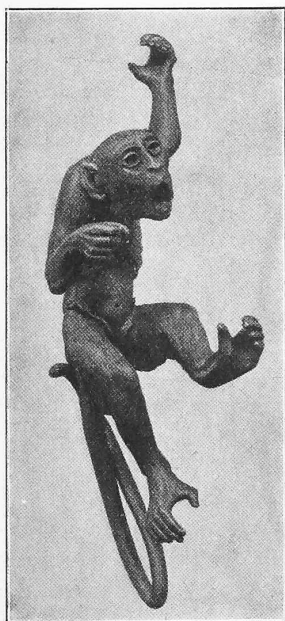
Abb. 2. Detail vom Parktor der Villa Jul. Schoch in Zürich V.

Das einfacher gehaltene Umfassungsgitter, das zwischen einzelnen Mauerpfosten eingestellt ist, wird seinerseits wieder von Mittelstücken unterbrochen, in denen sich das Rankenmotiv der Seitenteile des Tores wiederholt. Darüber sind realistisch ausgebildete Blumenkörbe aufgehängt, die zur Aufnahme von Topfpflanzen bestimmt sind (Abb. 5, S. 98).