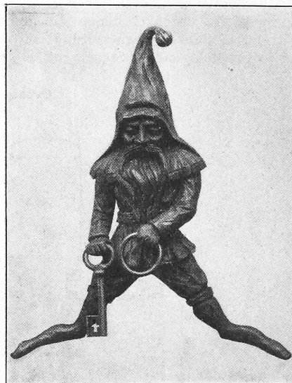
Abb. 3. Detail vom Parktor.

Entworfen von Pfleghard & Häfeli , ausgeführt von O. Bertuch .