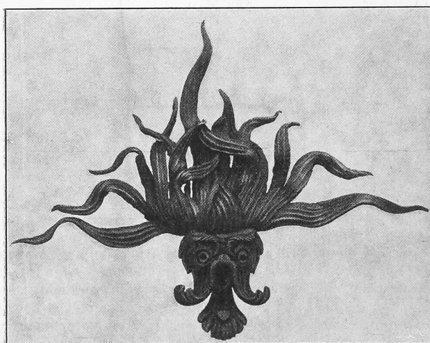
Abb. 4. Detail vom Parktor.

Nicht beipflichten können wir dem Verlangen nach Beiziehung von Praktikern als Examinatoren für die Prüfungen (Antrag II). Abgesehen