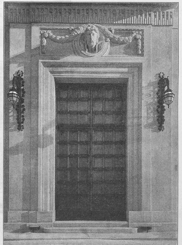
Abb. 6. Ansicht des Hauptportals.

Nun ist aber mit dieser Erkenntnis die Frage der Schifffahrtsverbesserung des Stromes noch keineswegs erschöpft; denn parallel mit der dauernden Erhöhung der Niederwasserstände geht die Initiative zur Ausbeutung des Oberrheins für hydro-elektrische Energiegewinnung. Wenn auch der Strom unterhalb Basel nicht mehr wie auf der Strecke Schaffhausen-Basel natürliche Gefällskonzentrationspunkte, wie die Stromschnellen in Rheinfeldern, Laufenburg,