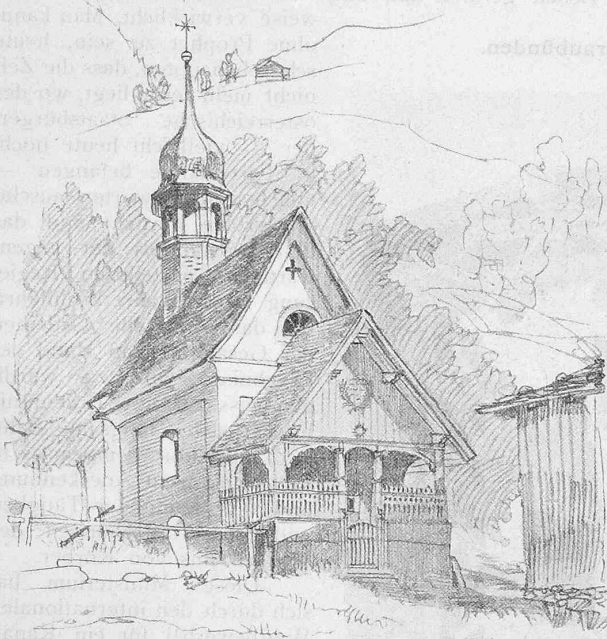
Abb. 2. Kapelle bei Truns von 1676. Bleistiftskizze von Architekt J. Kunkler in Zürich.

1. Ausgestaltung des Bahnnetzes südlich von der Donau behufs intensiverer Verbindung und bequemerer Zufuhr zum Hafen von Triest, nachdem die Alpen die Anlage von Wasserstrassen in dieser Richtung ausschliessen.