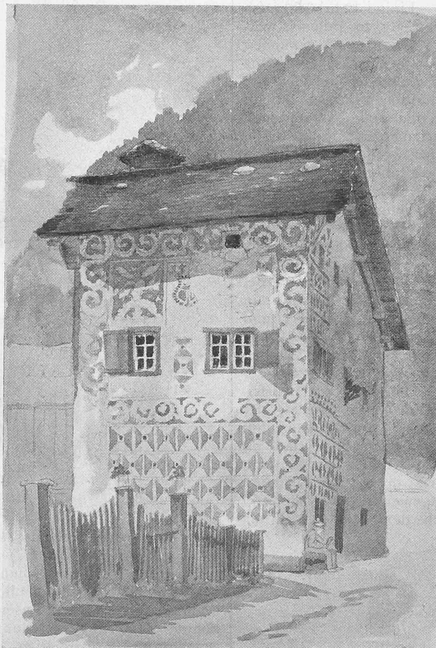
Abb. 4. Altes Haus in Andeez

Nach einem Aquarell von Architekt J. Kunkler in Zürich.