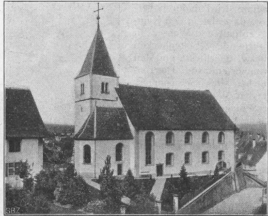
Abb. 1. Ansicht der alten Pfarrkirche von Nord-Ost.

Nachteile des Systems sind, dass Störungen völligen Unterbruch des Betriebes bedingen und dass die Verwendungsfähigkeit eine begrenzte ist, da die Höhe von 20,0 m die untere Grenze der Anwendungsfähigkeit ergibt, weil dann die Trogtrommeln mit ihren, durch die Schiffsgrösse gegebenen Abmessungen so nahe aneinander rücken, dass die Konstruktion des Hubzylinders unmöglich wird. Grössere Hubhöhen als 36,0 m würden andererseits zu ungeheuerlichen Abmessungen und schwer ausführbaren Konstruktionen führen. Immerhin zeichnet sich dieses Projekt durch grosse Leistungsfähigkeit, grosse Betriebssicherheit und geringe Betriebskosten aus, sodass es von Wert wäre, ein derartiges Hebewerk ausgeführt zu sehen.