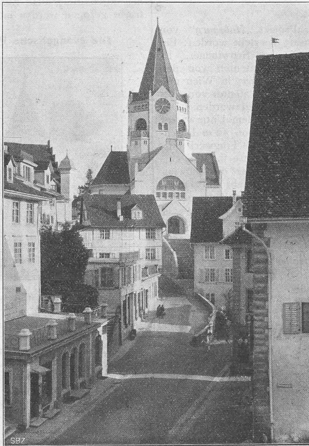
Abb. 6. Ansicht der neuen Kirche in Weinfelden vom Marktplatz aus.