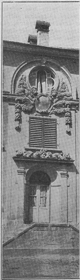
Abb. 1. Portal der alten Hochschule in Bern. (Aus „Schweizer Kunstkalender 1906“.)

Was die eigentliche Form der Säule betrifft, so gibt sie die Lage der in ihr befindlichen Träger an. Ein Schnitt würde genügen, um diese Stellung erkenntlich zu machen; die Kontur der Säule folgt der der Träger selbst. Im Schnitt dargestellt, geht diese Kontur von einem Winkel aus, den sie überstreift; folgt dann dem Flantsch des Trägers und höhlt sich im Zwischenraum des ersten und zweiten Trägers, nimmt und verfolgt dann eine andere Richtung und macht den Winkel von neuem kenntlich. Bei dieser Wendung bildet die Linie eine Höhlung, um sich mit dem Steg des Trägers wieder zu