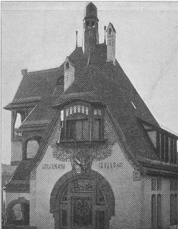
Abb. 7. Dach- und Giebeldetail.