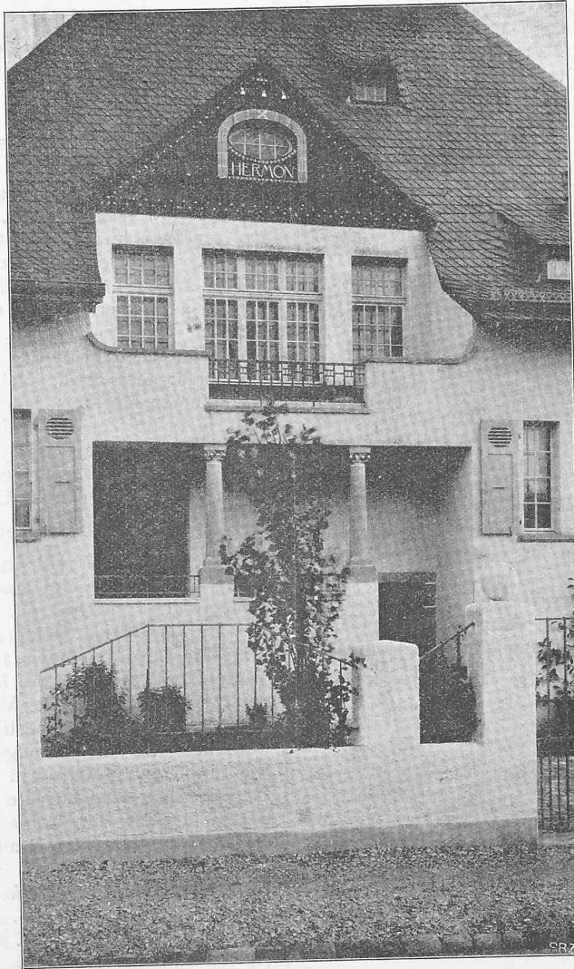
Abb. 1. Ansicht des Mittelteils der Strassenfassade.

für den m^3 zu der Bausumme von 763 500 Fr.