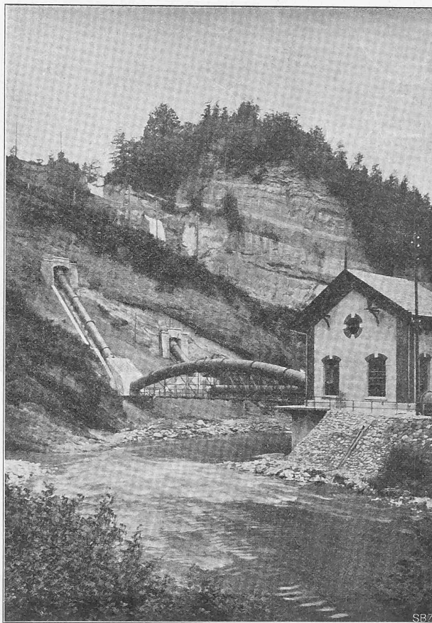
Abb. II. Ansicht des Maschinenhauses mit der zweiten Druckleitung.

Mauerkrone hinüber geführt würde. Allerdings kann der Weiher mittels dieser Ausführungsweise nur um etwa 7 m gesenkt werden, was indessen wenig zu sagen hat, da der tiefer liegende Teil des Weiherinhaltes nur noch 400000 m 3 beträgt und eine tiefere Absenkung bisher überhaupt noch nicht vorgekommen ist; die ganze Entleerung kann aber jederzeit mittels der alten Leitung erfolgen.