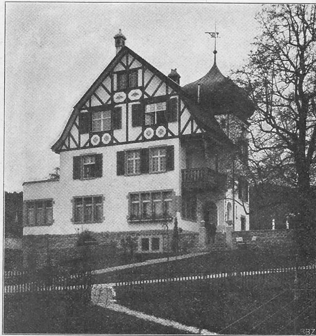
Abb. 1. Ansicht des Landhauses «Grieg» bei St. Gallen.

Der Verband deutscher Tonindustrieller hielt seine Hauptversammlung am Samstag den 16. Februar ab. Er verhandelte vorwiegend über wirtschaftliche Fragen, insbesondere sprach Dr. Fiabelkorn über die Ursachen des wirtschaftlichen Niedergangs des deutschen Verbländziegelgewerbes. Er führte diesen Rückgang auf die ablehnende Haltung der Verblenderfabrikanten gegenüber den Wünschen der Architekten zurück. Die grossen Zieglervereine wollen in ihren folgenden Sitzungen über Mittel zur Abhilfe beraten. Weitere Vorträge behandelten unter anderem die in Berlin neu