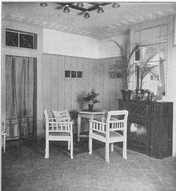
Abb. 2. Kaminecke der Diele. Von Prof. R. Rittmeyer.

Und nun, da das schöne Unternehmen fertig dasteht, nach der glücklichen Ausführung unter so schwierigen Verhältnissen und ausserordentlichen Schwierigkeiten, kann man wohl mit voller Befriedigung auf jene Zeit zurückblicken, in der der Kampf mit harter, angestrengter und aufreibender Arbeit geführt wurde; es waren Jahre schwerer Prüfung, in denen der Mut zeitweise zu sinken drohte und dem Erliegen nahe war. Aber das Vertrauen der leitenden Ingenieure ruhte auf festen Grundlagen; sie befanden sich vor einem Bau, den Niemand so schwierig und so gefährvoll hätte ahnen können; sie hatten sich vorgenommen, den Bau auszuführen, und in diesem festen Vorhaben scheuten sie keine Mittel, keine Arbeit, kein Opfer; ungeahnten und noch nie dagewesenen Verhältnissen setzten sie ungewöhnliche und noch nicht angewandte Mittel entgegen. Der Sieg blieb den Mutigen, die angewandten Systeme bewährten sich mit glänzendem Erfolge, was den Ingenieuren die dabei tätig waren, zur hohen Ehre gereicht.