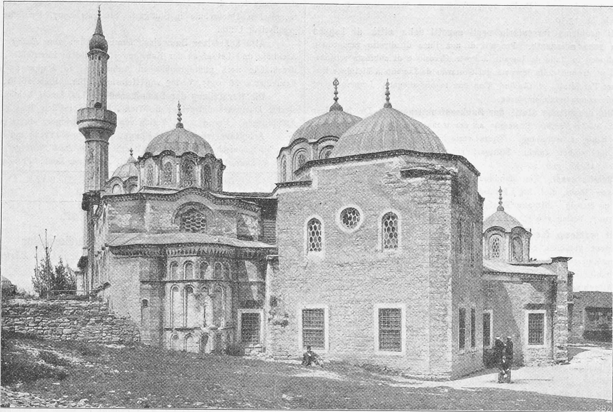
Abb. 2. Ostansicht der Kirche Pammakaristos (Fethie Dschami) in Fanar.

Aus: „Die Baukunst Konstantinopels“ von Corn. Gurlitt . Verlag von Ernst Wasmuth A.-G. in Berlin.