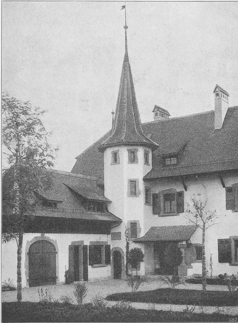
Abb. 4. Mittelpartie der «Villa des Amandolliers». — Architekt Ed. Fatio .