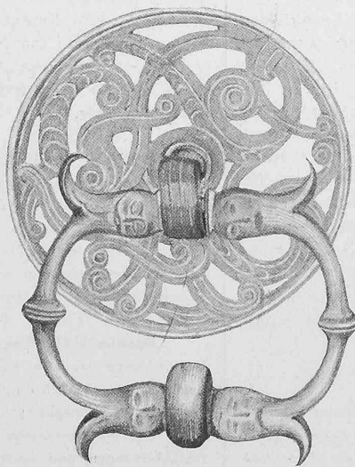
Abb. 6. Türklopper an der Renaissancepforte des Bezirksschulhauses in Brugg.