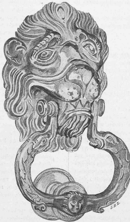
Abb. 4. Türklopper an einer eichenen Tür gegenüber dem Rathause in Zofingen.

Skizzen von Architekt M. Lutz aus Zürich.