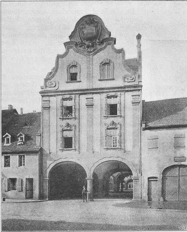
Abb. 5. Ansicht der Fassade des Strassendurchbruchs an der kath. Kirchstrasse in St. Johann a. d. Saar.