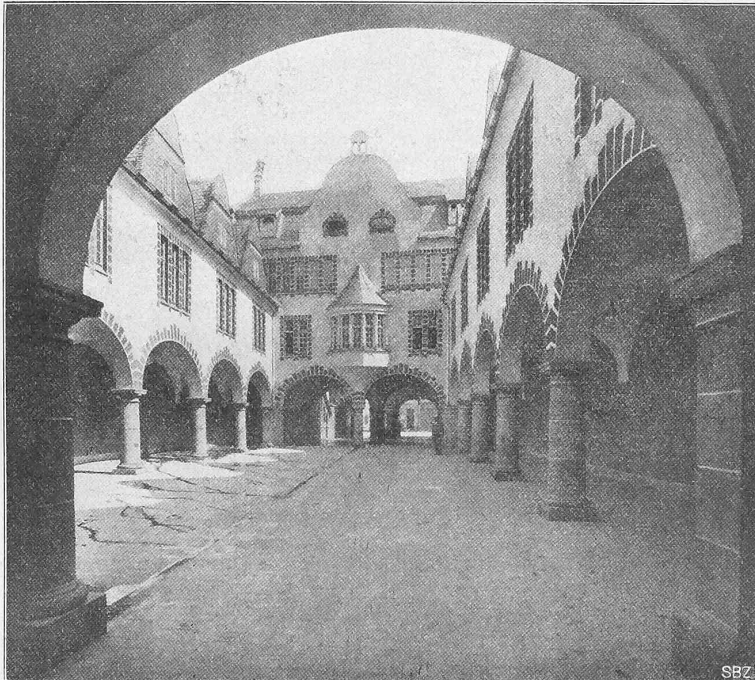
Abb. 3. Blick in den grossen Hof nach der kathol. Kirchstrasse.

Erbaut von Architekt G. Schmohl in St. Johann.