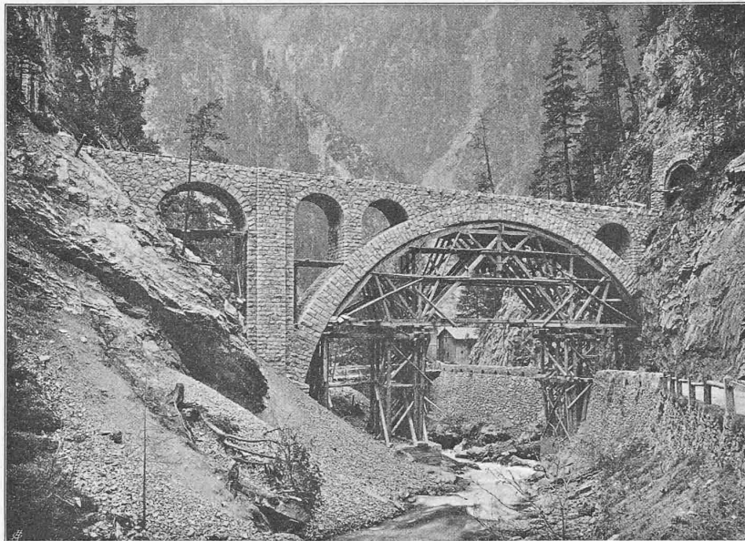
Abb. 11. Landwasserviadukt in den «Zügen», zwischen den Brombenz-Tunnels I und II.

führte und dessen Bett in der ganzen Breite und auf eine Länge von 120 m bis auf die Höhe des seiner Mündung gegenüberliegenden Bahndammes vollständig ausfüllte. Das zurückgestaute Landwasser überspülte und durchbrach den Bahndamm und ergoss sich in eine dahinterliegende Materialgrube, um 120 m weiter unten, den Bahndamm nochmals durchbrechend, in sein Bett zurückzufließen (Abb. 2). Dieser Ausbruch des Wildbaches erfolgte trotz einer bestehenden Verbauung mit 10 Talsperren, die bis auf eine Stand hielten. Durch eine bereits beschlossene Erweiterung der Ver-