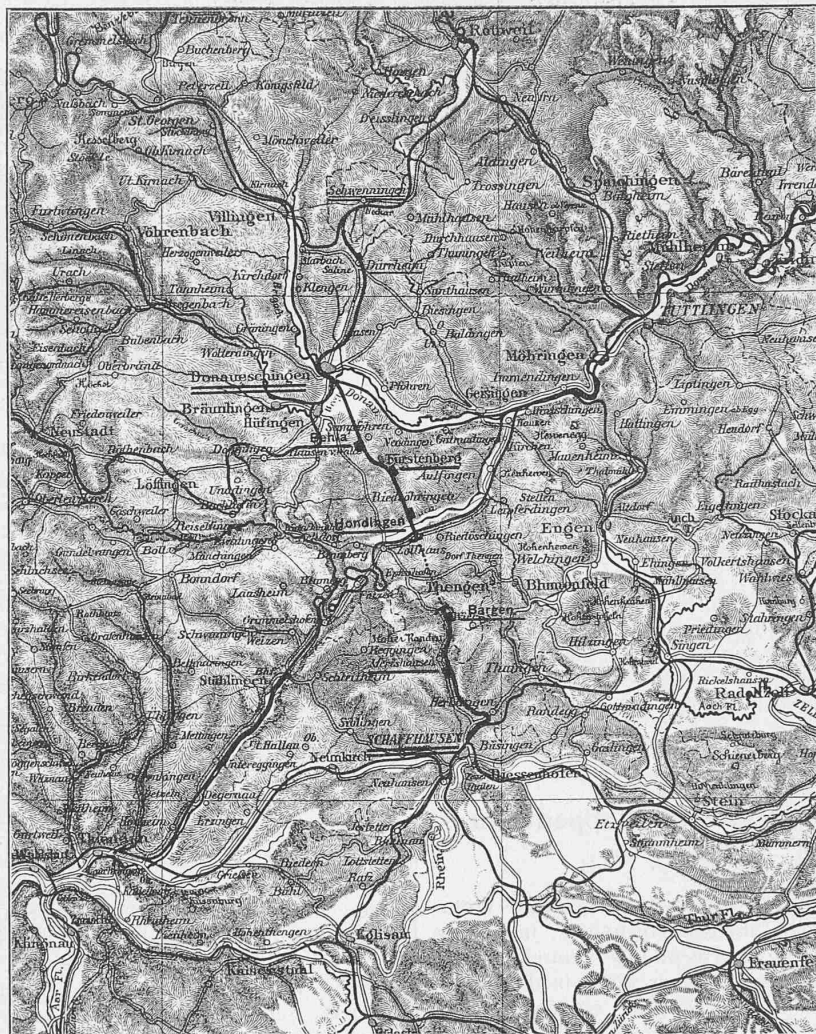
Übersichtskarte der Randentbahn, Projekt C. — Masstab 1 : 500 000.

Im Vergleich zu der alten Linie Schaffhausen-Donaueschingen sind die Hauptverhältnisse der besprochenen Projekte folgende: