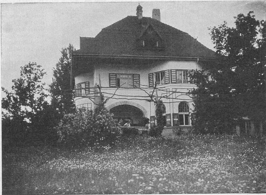
Aus E. v. Seidl, «Mein Landhaus», Verlagsanstalt Alexander Koch, Darmstadt. — Das Wohnhaus.

Wiese an der alten Strasse von Murnau nach Garmisch sass. Ein sonniger Hang fällt sanft gegen eine grosse mit bewaldeten Kogeln durchzogene Ebene ab, ein altes Seebecken, und somit immun gegen alle schlechten Villen, die allenfalls Lust hätten, die schöne Landschaft zu verderben. Ein malerisches Dorf bildet einen reizenden Vordergrund, während eine Kette von Bergen, die sich immer weiter kulissenförmig bis zum Wettersteingebirge in wundervoller Grup-