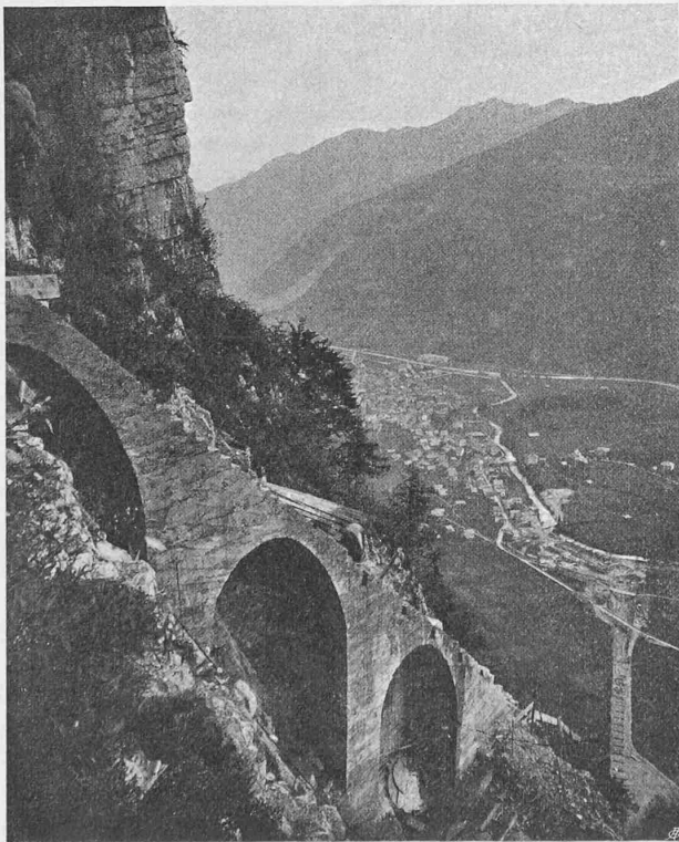
Abb. 62. Oberste Partie des Druckleitungs-Unterbaues (Juni 1907).

In der steilen Partie des Tracés, vom Galerieportal bis zum Gefällswechsel, hat der Druckleitungsunterbau, einschliesslich Seilbahn, eine Gesamtbreite von 9 bis 10 \text{ m} . Er ist durchwegs auf gewachsenem Fels fundiert und in seiner ganzen Länge als ununterbrochene Betontreppe mit 30 \text{ cm} hohen Stufen ausgebildet. Bei den Runsenkreuzungen ruht dieselbe auf Viadukten. In der flach verlaufenden Strecke zwischen dem Bergfuss und dem Maschinenhaus beträgt die Breite des Unterbaues nur noch 7 \text{ m} . Er ist hier auf Bergsturzmaterial und Kies fundiert und, um die Pfeilerfundamente gegen Ausspülungen zu sichern, in seiner ganzen Breite mit einer rund 0,20 \text{ m} dicken Betonschicht abgedeckt. Die in Zementbeton ausgeführten Verankerungsklötze sind in der steilen Partie durch Eiseneinlagen mit dem Felsen verankert und armiert (Abbildungen 62 bis 64).