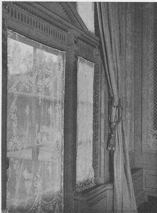
Abb. 32. Fensterheizung im Burgerratssaal des Berner Kasino.

Wie früher bemerkt, führt vom Haupt-Dampfverteiler je eine Dampfleitung zu zwei Dampfverteilern, von denen vier Gruppenleitungen direkt nach der untern, fünf Leitungen durch den von oben kommenden Zuluftschacht für G, S und F