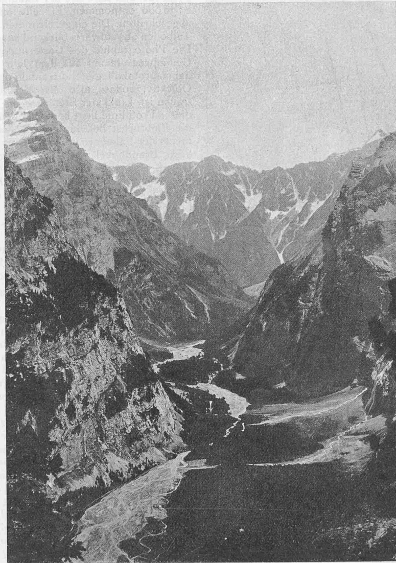
Abb. 2. Blick vom «Stock» am Gemmiweg (1833 m) ins Gasterntal, Richtung Brandhubel und Sackhorn (vergl. Karte Abb. 3).