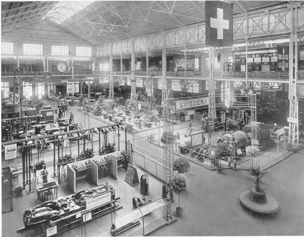
DIE SCHWEIZERISCHE MASCHINENAUSSTELLUNG AN DER WELTAUSSTELLUNG TURIN 1911