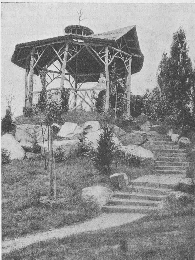
Zwei Beispiele kunstloser Gartenanlagen im sog. „Naturstil“. — Nach dem Buche „Gartentechnik und Gartenkunst“ (Text siehe Seite 299).