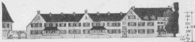
Abb. 7. Strassenfront der Beamten-Wohnhäuser. — 1 : 750.

Als bestehende Verkehrsstrassen waren zu berücksichtigen die vom Endpunkt der Strassenbahn, dem alten Schützenhaus (im Plane rechts unten) über die Ebene fächerartig ausstrahlenden Strassenzüge, zunächst die Randenstrasse, die in nordwestlicher Richtung diagonal verlaufend das Feld in zwei Teile schneidet. Nach Westnordwest zieht sich die Rietstrasse und nach Norden, am östlichen Rand der Ebene, die Nordstrasse. Eine