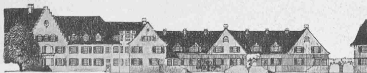
Abb. 8. Gartenfront der Beamten-Wohnhäuser. — Masstab 1 : 750.

der in solchen Wohnstrassen ja nie lebhafter Wagenverkehr im mindesten gehemmt würde. Die leichte Krümmung der meisten Strassen sowie die gelegentlichen Versetzungen um Strassenbreite, ein einfaches und mit Erfolg vielfach angewendetes Mittel, haben den Zweck, die Kraft des Windes zu brechen; abgesehen davon sind sie für das