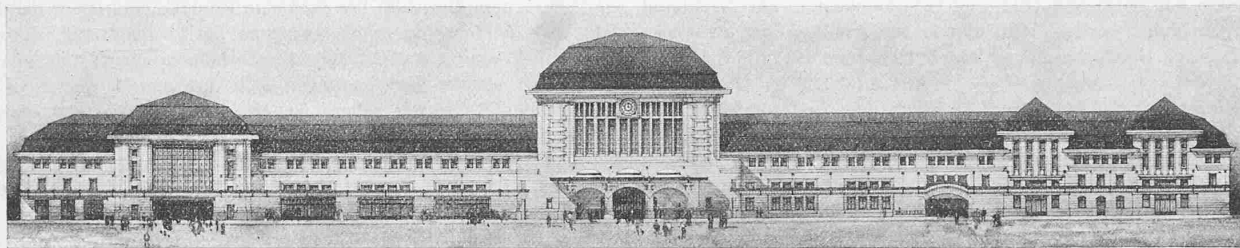
Gesamtansicht gegen den Bahnhofplatz. — Masstab 1:1200.

Endgültiger, in Ausführung begriffener Entwurf der Architekten Tailens & Dubois und Monod & Laverrière in Lausanne.