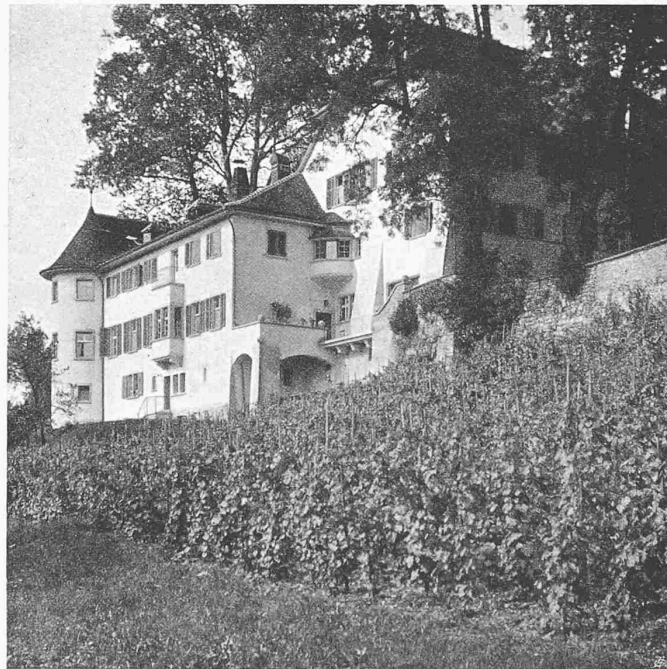
Oben von N.-W.