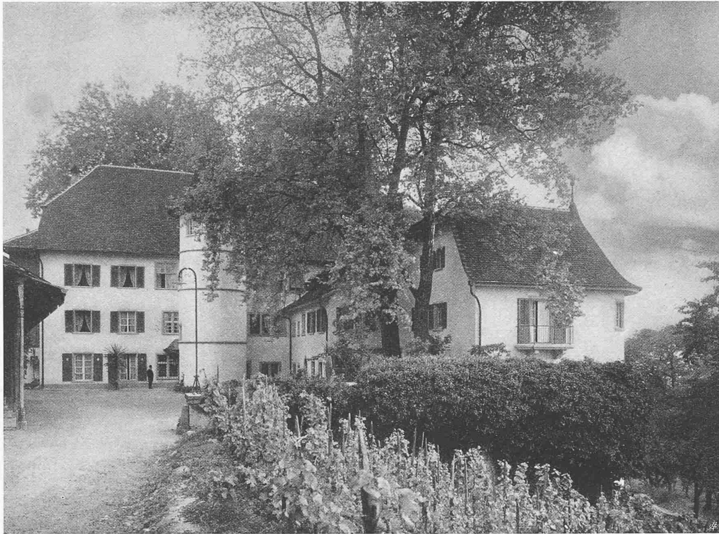
KURANSTALT BRESTENBERG AM HALLWYLERSEE ERWEITERT DURCH ARCH. EUGEN PROBST, ZÜRICH Hofansicht von Nordost