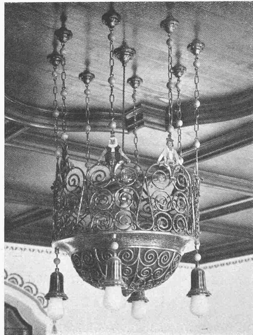
Tafel 60: Die neue Halle Tafel 61 oben: Speisesaal Unten: Leuchter der Halle