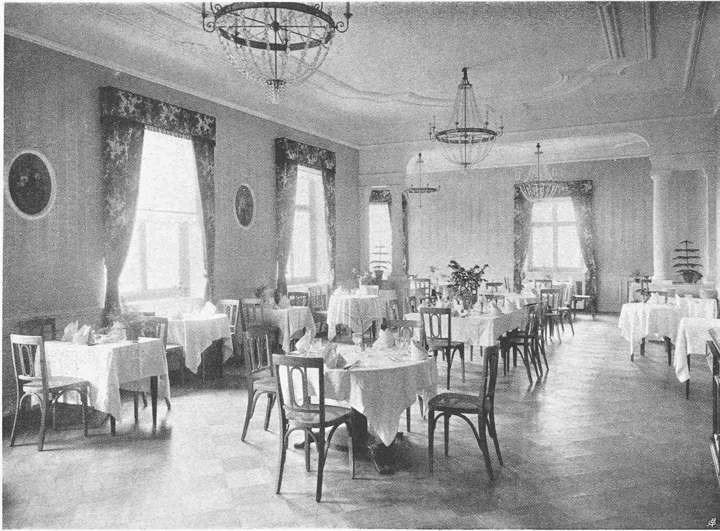
KURANSTALT BRESTENBERG AM HALLWYLERSEE ERWEITERT UND UMGEBAUT DURCH EUGEN PROBST, ARCHITEKT IN ZÜRICH