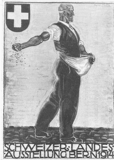
II. Preis ex aequo. Verf. O. BAUMBERGER, Zürich