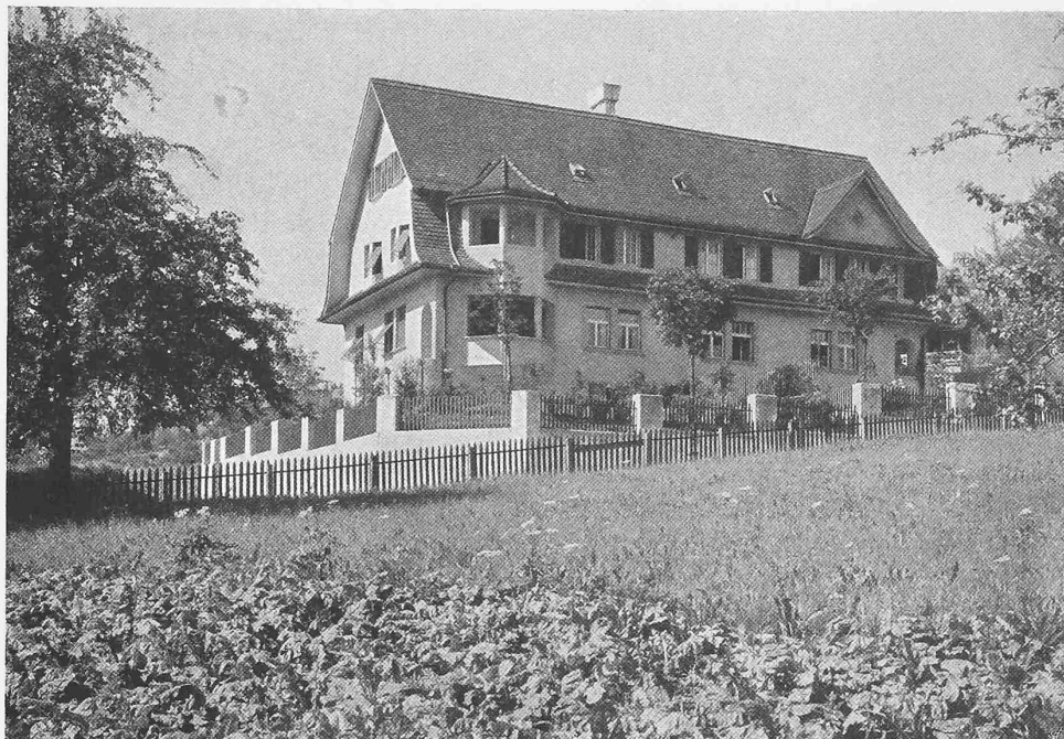
Oben von Südwest