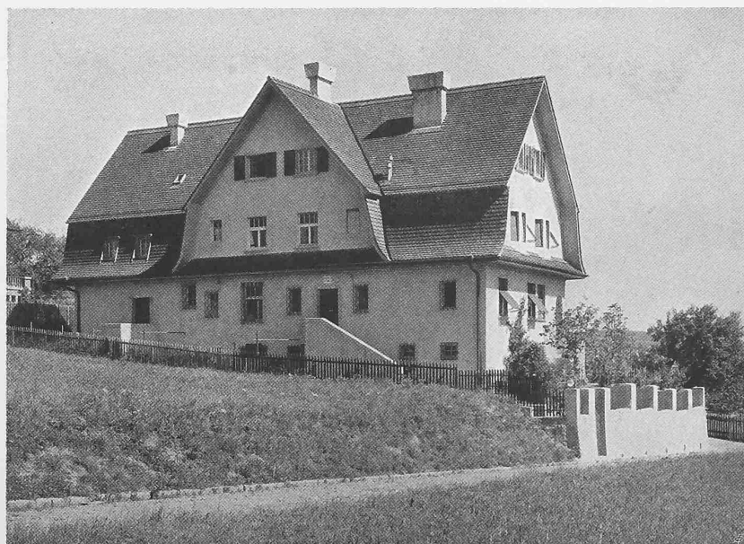
Unten von Nordwest