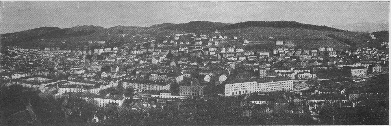
Abb. 1. Ansicht von St. Gallen mit dem Wettbewerbsgebiet vom gegenüberliegenden Hang des Rosenberges.

„Rudolf Gelpke“ und „Fendel 22“ die Rückreise nach Basel anzutreten und unterwegs die Augster Schleuse und die Kraftwerke Augst-Wyhlen, sowie in Basel die Hafenanlagen zu besichtigen. Ein einfaches Abendessen soll die gemeinsame Tagung beschliessen.