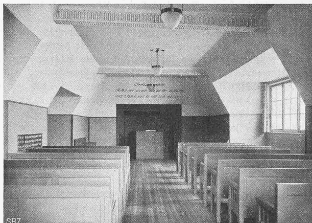
Abb. 3. Asyl «Gottesgnad» in Mett bei Biel; Predigtsaal.

worden. Altersschwach und von den Unwettern übel mitgenommen, wurde sie dann im Herbst 1892 unter grossen Kosten von der Meglisalp nach dem Observatorium auf der Spitze durch ein armiertes, auf die Erde gelegtes einadriges Telegraphenkabel ersetzt und damit wenigstens der obere Teil der Telegraphenlinie, der vorher