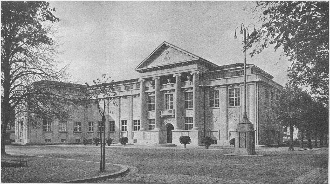
Abb. 2. Gesamtansicht des neuen Museums aus Südosten, Ecke Museum- und Lindstrasse.