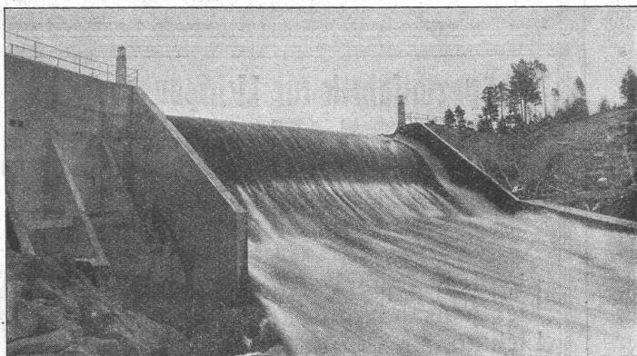
Selbsttätiges Ueberfallwehr Osfaldet für Aamot kommunale Elektrizitätsverk (Norwegen).

4-gespalit. Pettizelle oder deren Raum . 30 Cts. Haupttitelseite: 50 Cts. Alleinige Inseraten-Annahme: Rudolf Mosse, Annoncen-Expedition, Zürich, Basel und deren Filialen und Agenturen