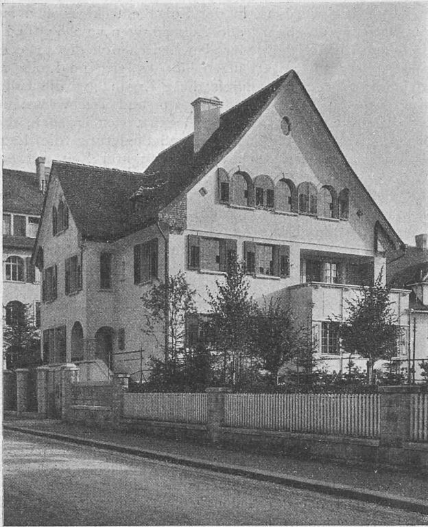
Abb. 21. Einfamilienhaus Streulistrasse 54, Zürich, von Norden.