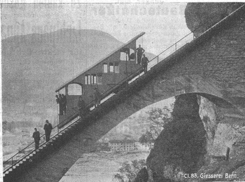
Cl. 83. Giesserei Bern.