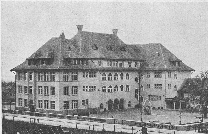
Abb. 6. Hofansicht des Letten-Schulhauses, aus Norden.

Im Innern berührt angenehm die abwechslungsreiche Führung der Treppen und die Weiträumigkeit der Korridore (Abbildungen 8 bis 11, Seite 274 und 275). In je einem geraden Lauf erreicht man