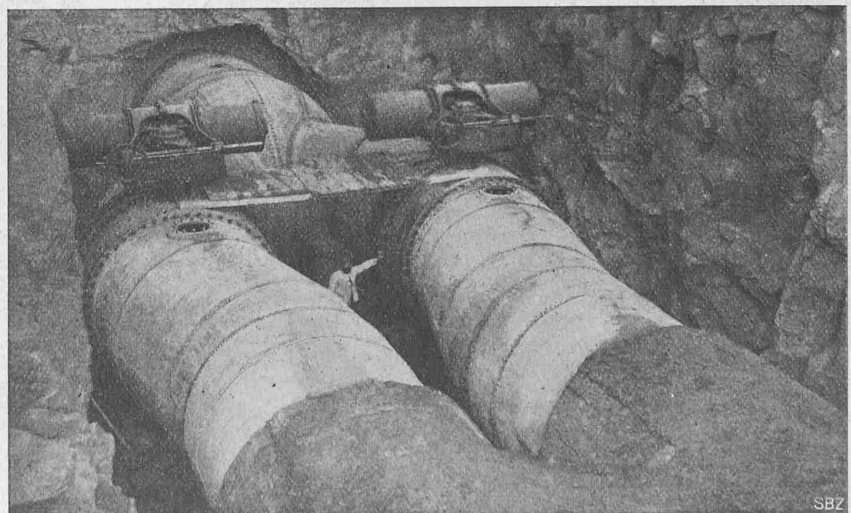
Abb. 34. Fertig montierte Gabelung der Druckleitung, vor der Einbetonierung.

Zwischen dem untersten Krümmer und der Verteilung (Abb. 40, S. 213) ist an jeder Leitung noch eine Leerlaufleitung angeschlossen, die in einem Bogen nach abwärts abzweigt und durch hydraulisch betätigte Drosselklappe und Schieber abgeschlossen werden kann (Abb. 41). Die Leitung selbst ist mit Drosselvorrichtungen, eingebauten Widerständen (Abbildung 42) ausgerüstet, die den grössten Teil der dem Druck entsprechenden Energie aufzehren. Die Leerlaufleitung mündet unterhalb des niedrigsten Wasserspiegels des Unterwassergrabens in diesen aus, um in jedem Falle noch eine Dämpfung durch das