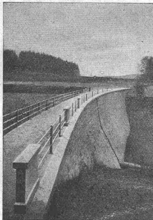
STAUMAUER f. KUBELWERK

Elektro-Mechan. Reparaturwerkstätte Zürich Hardturmstr. 121, Zürich 5. „Orion“.