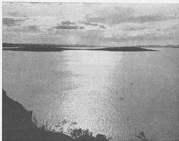
Abb. 8. Blick gegen Westen, über die „Hufeisen-Insel“ (6 in Abb. 5).