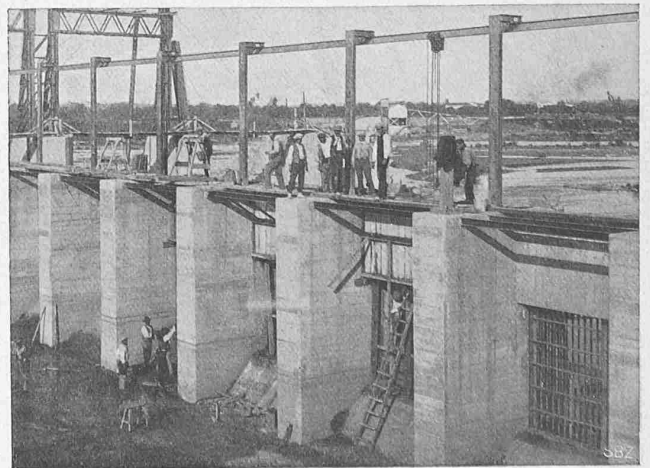
Abb. 61. Einlauf mit Grob-rechen, von der Innenseite.

Bevor der Verfasser dieser Anregung sich zu ihrer Veröffentlichung entschloss, hat er die vorgeschlagene Methode vor einem Jahr selbst eingeführt und an einem namhaften Beispiel ganz durchgeführt, praktisch probiert und mit der Abrechnung nach besten Kräften abgeklärt. Das dabei erhaltene Resultat folgt nun hier als Vorschlag für eine allgemein brauchbare Einteilungsübersicht für den: