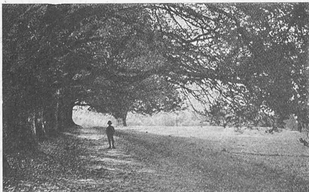
Abb. 3. Die Zofinger Festwiese, der „Heiternplatz“.

Von Aarburg herkommend, durchzieht diese Strasse die Altstadt, in der Richtung der in nebenstehendem Bebauungsplan eingezeichneten Pfeile, ungefähr von Nord nach Süd. Hemmend wurde bei Zunahme des Verkehrs die Erhöhung in Stadtmitte, auf der die Kirche sich erhebt, und die den Durchgangsweg zu einer westlichen Ausbiegung zwingt. Dabei findet sich eine böse Ecke beim Hause „Central“ (Abb. 1), eine andere beim ehemaligen