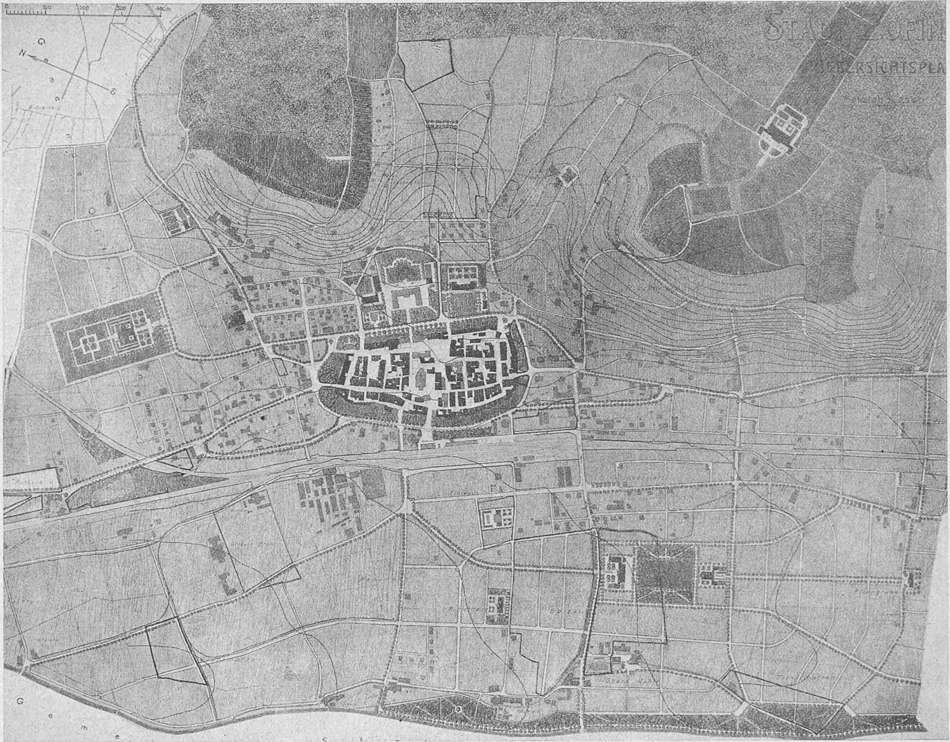
Ueberbauungsplan Zofingen. — II. Preis ex aequo, Entwurf Nr. 1. — Architekt J. B. Meier-Brann in Basel. — Masstab 1 : 12 500.

Bausumme gut gelöst werden kann. Wenn sie dies auch durch Gutheissen des Programms bestätigt haben und die ausschreibende Behörde damit rechnet, so hindert das nicht, Idealprojekte, denen bei Aufwand beliebiger Bausummen freiere Schönheit eignen kann, den Projekten vorzuziehen, die sich „nur einseitig mit der Aufgabe beschäftigen“, und das Innere und Aeusserere den gegebenen Mitteln entsprechend zu gestalten bemüht sind.